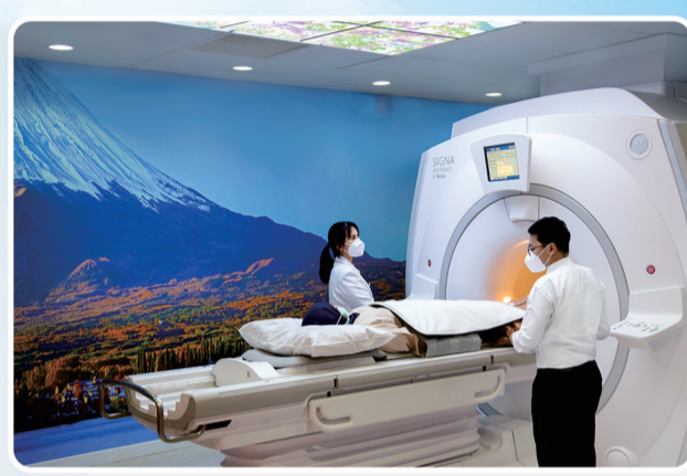
MRI 3 TESLA